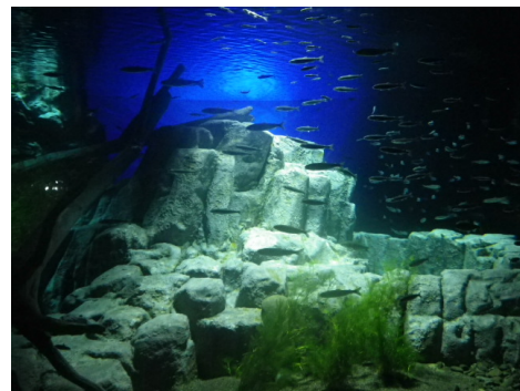
自慢の支笏湖水槽

札幌市豊平川さけ科学館 : 連休最終日の 9 月 23 日(水)に恒例の「さけフェスタ 2015」が開催されます。今年もサケの重さ当てクイズやイベント、森と水辺の体験等、一日中楽しめる構成になっております。奮ってご参加ください。